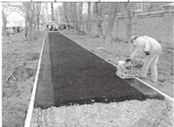
Устройство (ремонт) тротуаров