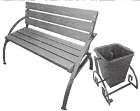
Устройство зон отдыха (скамейки, урны)