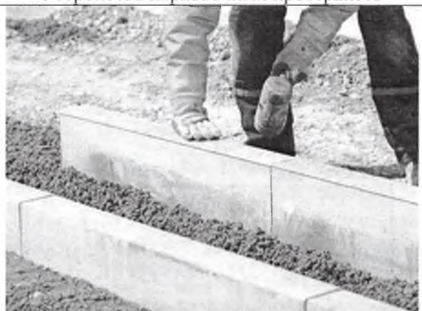
Установка или замена бордюрного камня