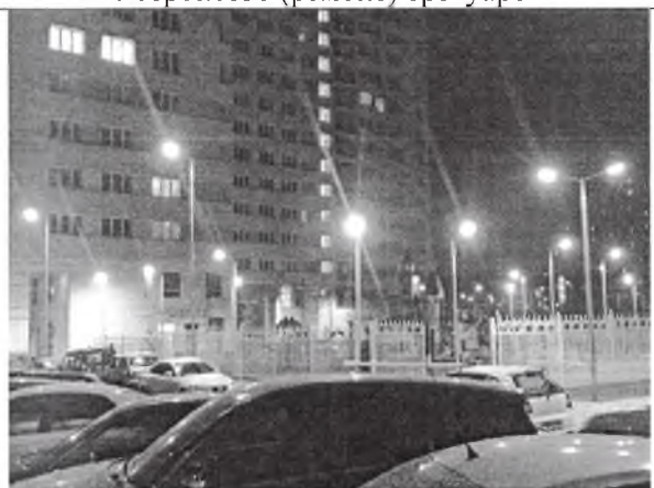
Освещение дворовой территории