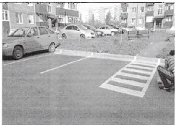
Устройство парковочных пространств