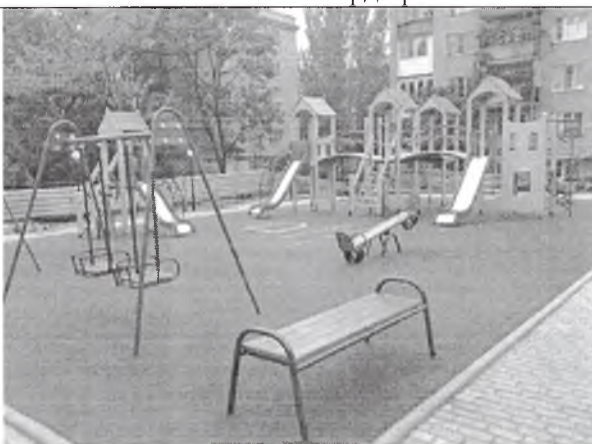
Установка детских и спортивных площадок с безопасным резиновым покрытием