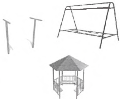
Установка малых архитектурных форм