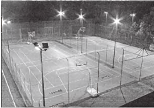
Дополнительное освещение детской и спортивной площадок