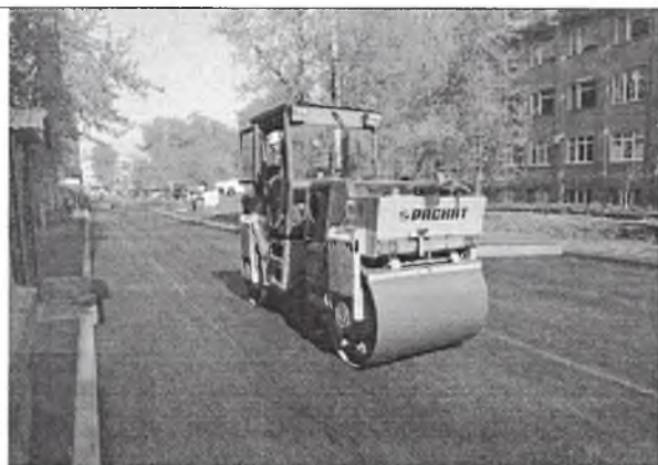
Асфальтирование дворовых проездов