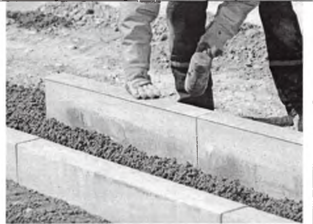
Установка или замена бордюрного камня