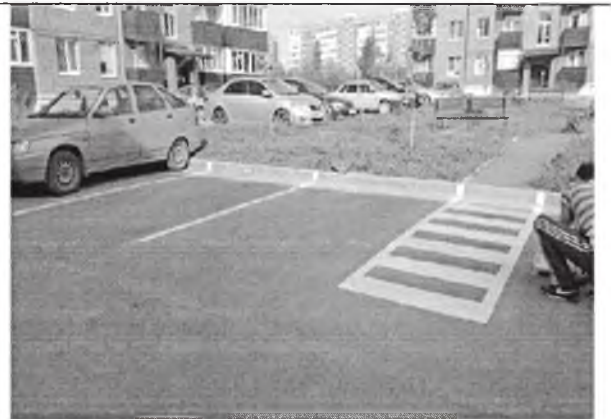
Устройство парковочных пространств