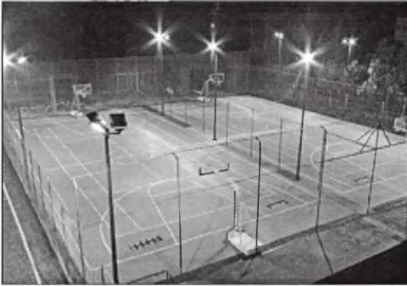
Дополнительное освещение детской и спортивной площадок