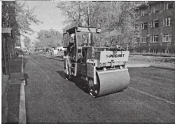
Асфальтирование дворовых проездов