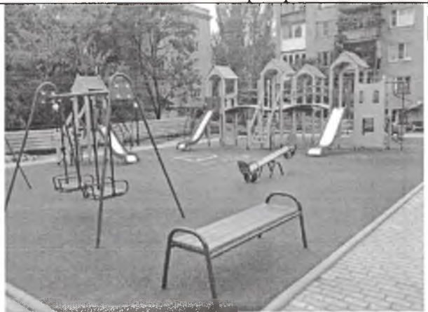
Установка детских и спортивных площадок с безопасным резиновым покрытием