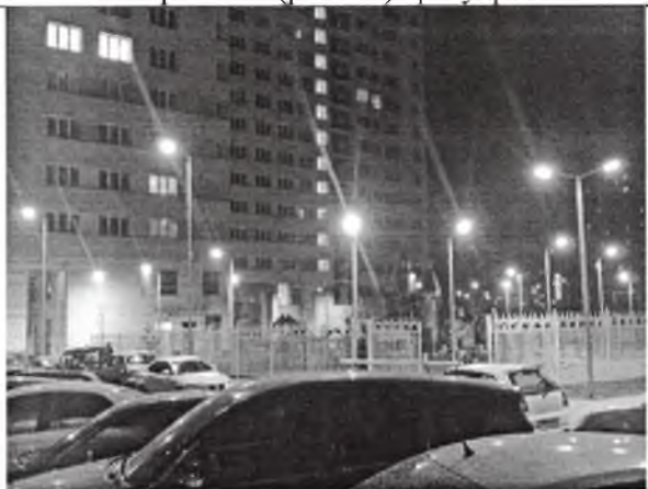
Освещение дворовой территории