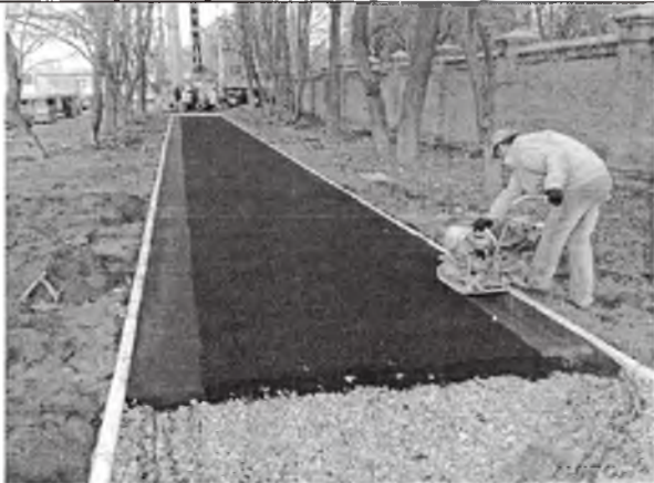
Устройство (ремонт) тротуаров