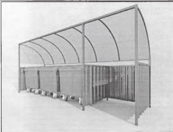
Установка контейнерных площадок (без контейнеров)